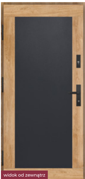
widok od zewnątrz

Uwaga! Drzwi dostępne tylko w opcji otwieranych na zewnątrz.