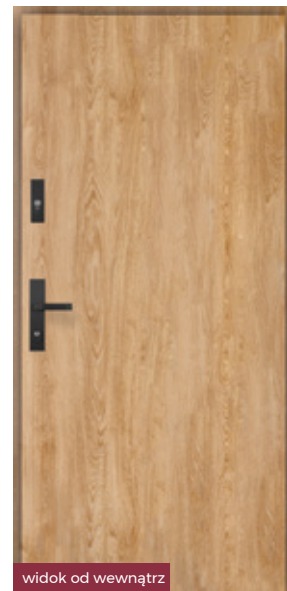
widok od wewnątrz