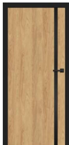
intarsja LUX 220 dopłata 247,00 zł* / 303,81 zł**