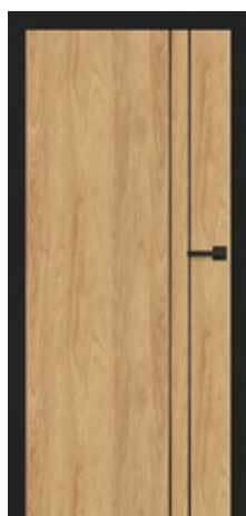
intarsja LUX 204 dopłata 247,00 zł* / 303,81 zł**