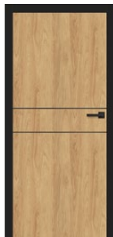
intarsja LUX 216 dopłata 247,00 zł* / 303,81 zł**

Osieźnica CZARNY ST CPL skrzydło DĄB CLASSIC CPL