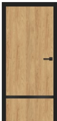
intarsja LUX 217 dopłata 247,00 zł* / 303,81 zł**