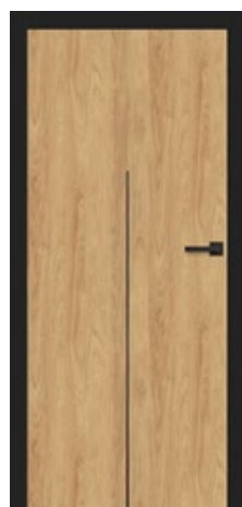
intarsja LUX 213 dopłata 247,00 zł* / 303,81 zł**