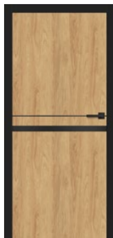
intarsja LUX 219 dopłata 247,00 zł* / 303,81 zł**