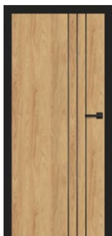
intarsja LUX 203 dopłata 247,00 zł* / 303,81 zł**