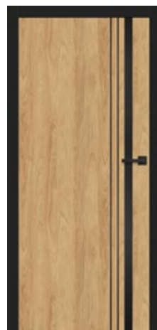
intarsja LUX 221 dopłata 247,00 zł* / 303,81 zł**