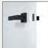
Obrzeże białe, zamek biały