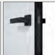
Obrzeże czarne, zamek czarny