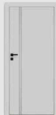
VETRO E popielaty (szyba DECORMAT)