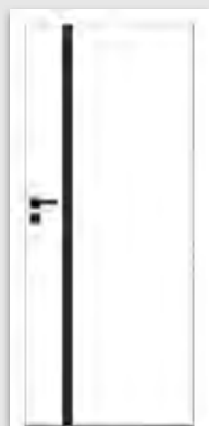
VETRO E biały (szyba czarna)