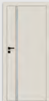
VETRO E latte (szyba DECORMAT)