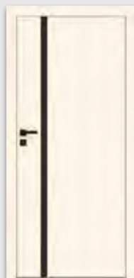
VETRO E ecru (szyba czarna)