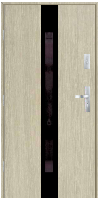
Strona wewnętrzna inox