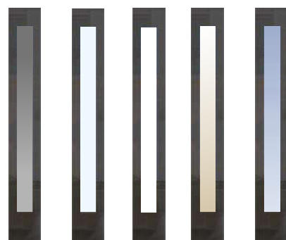
Grafit barwiona* Przezroczysta Mleczna Reflex Lustro weneckie*