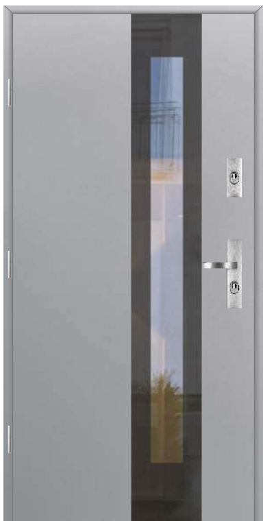
Wzór Glass View 3