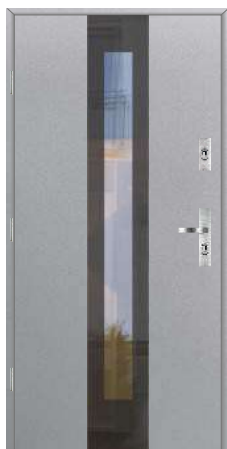
Wzór Glass View 3A