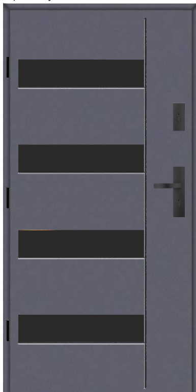
Aplikacja Glass 4

skrótu rozmiaru „N” w drzwiach z czwartą przylgą otwieranych do wewnątrz samozamykacza nawierzchniowego w Glass 3B