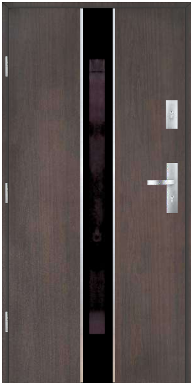
Wzór Perfekt 8-1 (ramka aluminiowa)