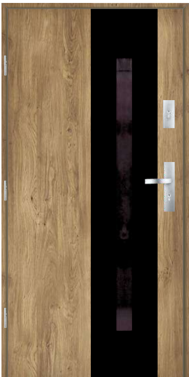
Wzór Perfekt 9