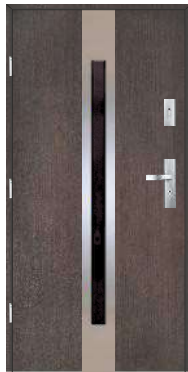
Strona wewnętrzna inox