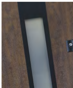
RAMKA CZARNY MAT