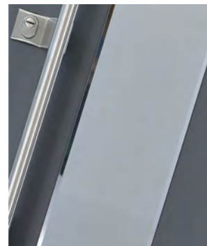
RAMKA LUSTRO WENECKIE